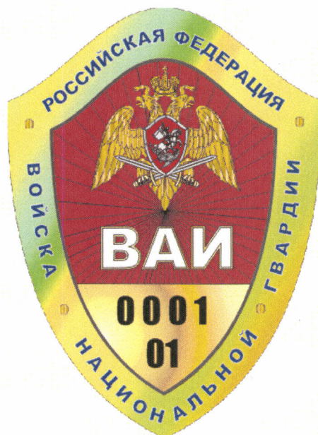
РИСУНОК официального геральдического знака – нагрудного знака различия инспектора военной автомобильной инспекции войск национальной гвардии Российской Федерации

Приложение № 2 к Положению об официальном геральдическом знаке – нагрудном знаке различия инспектора военной автомобильной инспекции войск национальной гвардии Российской Федерации, утвержденному приказом Федеральной службы войск национальной гвардии Российской Федерации от 02.03.2022 № 55